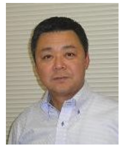
取締役 梱包部部长